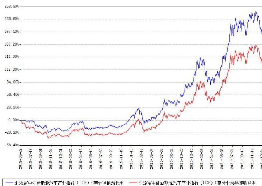
汇添富中证新能源汽车产业指数（LOF）C累计净值增长率与同期业绩基准收益率对比图