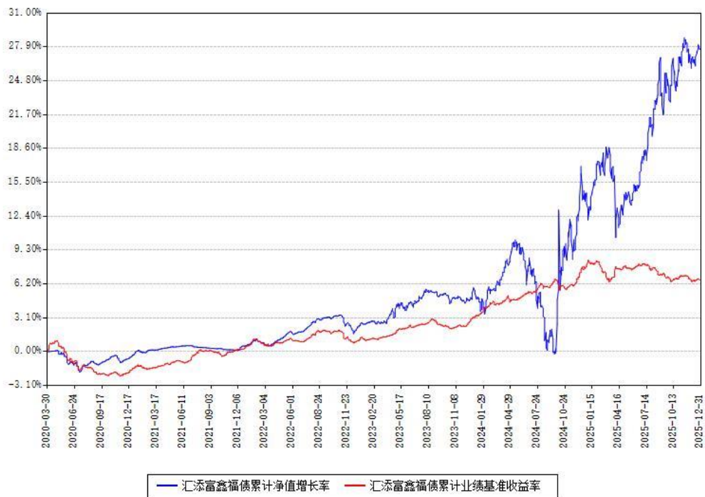
汇添富鑫福债累计净值增长率与同期业绩基准收益率对比图