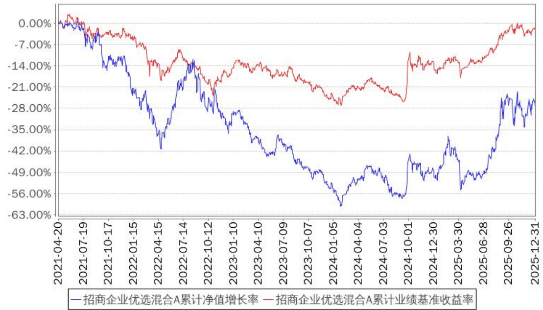
招商企业优选混合A累计净值增长率与同期业绩比较基准收益率的历史走势对比图