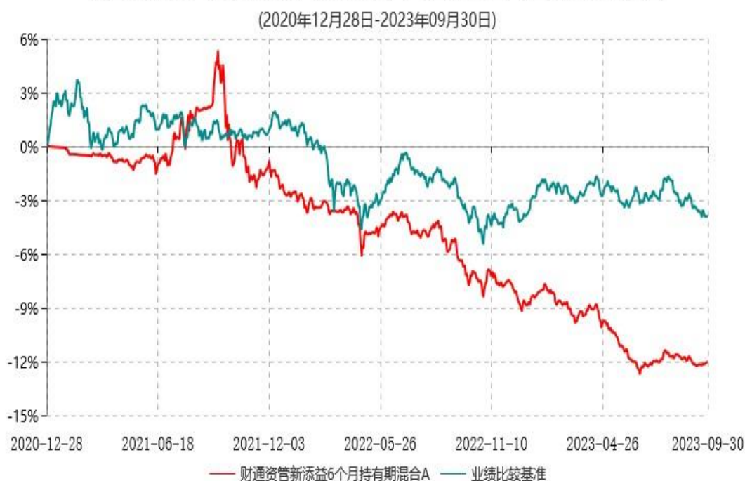
财通资管新添益6个月持有期混合A累计净值增长率与业绩比较基准收益率历史走势对比图