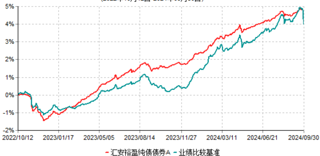
汇安裕盈纯债债券A累计净值增长率与业绩比较基准收益率历史走势对比图 (2022年10月12日-2024年09月30日)