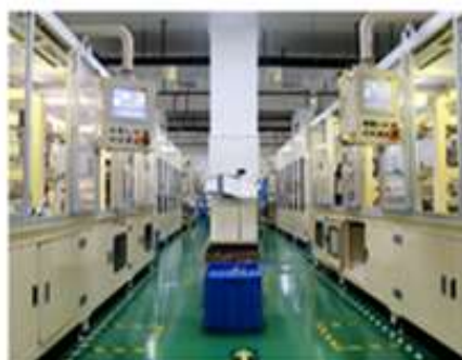
滤芯自动化生产线