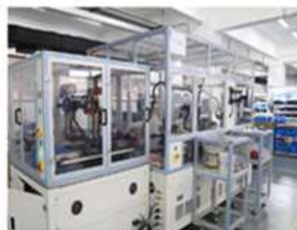
控制阀自动化生产线