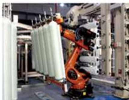
玻璃钢桶自动化生产线