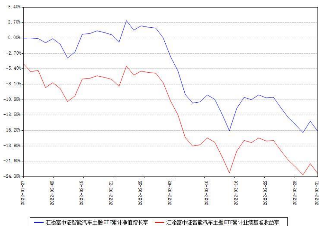
汇添富中证智能汽车主题ETF累计净值增长率与同期业绩基准收益率对比图

(二) 自基金合同生效以来基金累计净值增长率变动及其与同期业绩比较基准收益率变动的比较