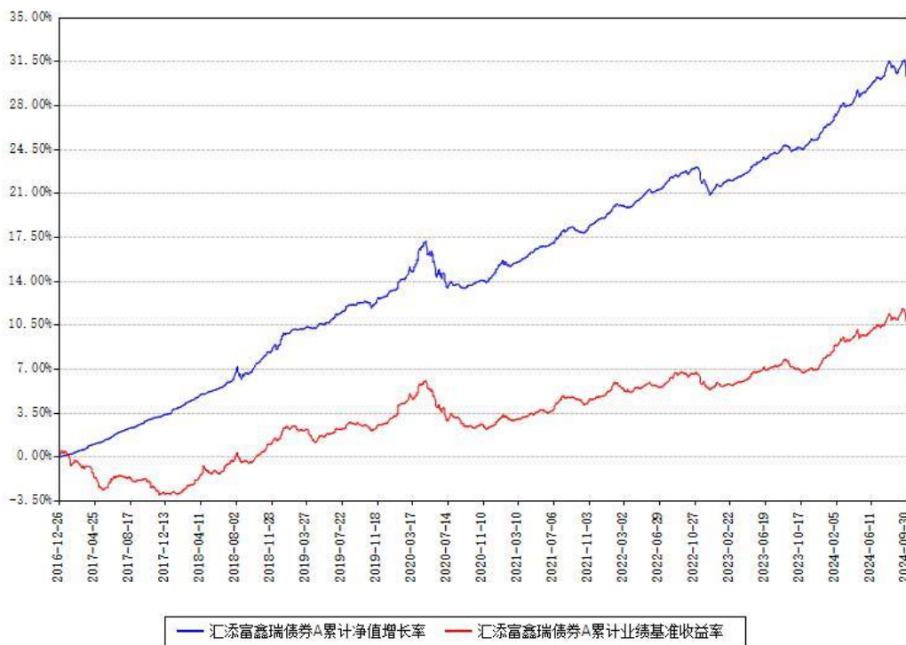
汇添富鑫瑞债券A累计净值增长率与同期业绩基准收益率对比图