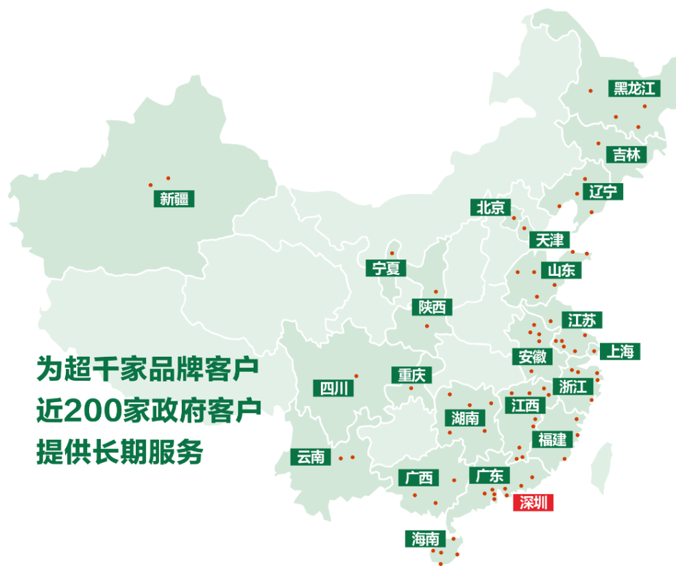
示图1：公司市政环卫和物业清洁业务全国分布图

公司先后通过了ISO9001质量管理体系认证、ISO14001环境管理体系认证、OHSAS18001职业健康安全管理体系认证。拥有深圳市环卫清洁服务企业环卫作业清洁服务甲级等级证书、公共设施维护能力甲级等级证书和城市生活垃圾经营性清扫、收集、运输服务许可证、道路运输经营许可证，具备中国清洁清洗行业国家一级资质、有害生物防治服务资质等专业资质。公司现为中国城市环境卫生协会常务理事单位。公司先后参与编制由中国城市环境卫生协会的《保洁员职业技能标准》、《背街小巷清扫保洁作业规程》、《道路及附属设施机械清洗作业规程》、《农村垃圾分类设施设置标准》。