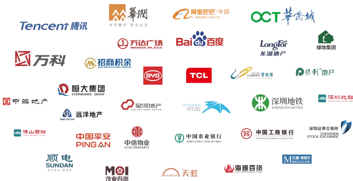
示意图2：公司物业清洁板块合作的部分品牌客户

经过24年的行业深耕，目前公司已积累大量长期合作的优质客户，与广州地铁、深圳地铁、万科物业、华润置地、龙湖物业、华侨城物业等保持长期稳定的合作关系。签署了多个精品项目，包括中国工商银行股份有限公司深圳分行项目、深圳招商银行大厦项目、腾讯大厦清洁服务项目、深圳证券交易所清洁服务项目、深圳世界之窗项目、深圳人才公园项目、中国人民大学图书馆项目、前海金融中心项目等，在行业内取得了良好的口碑。