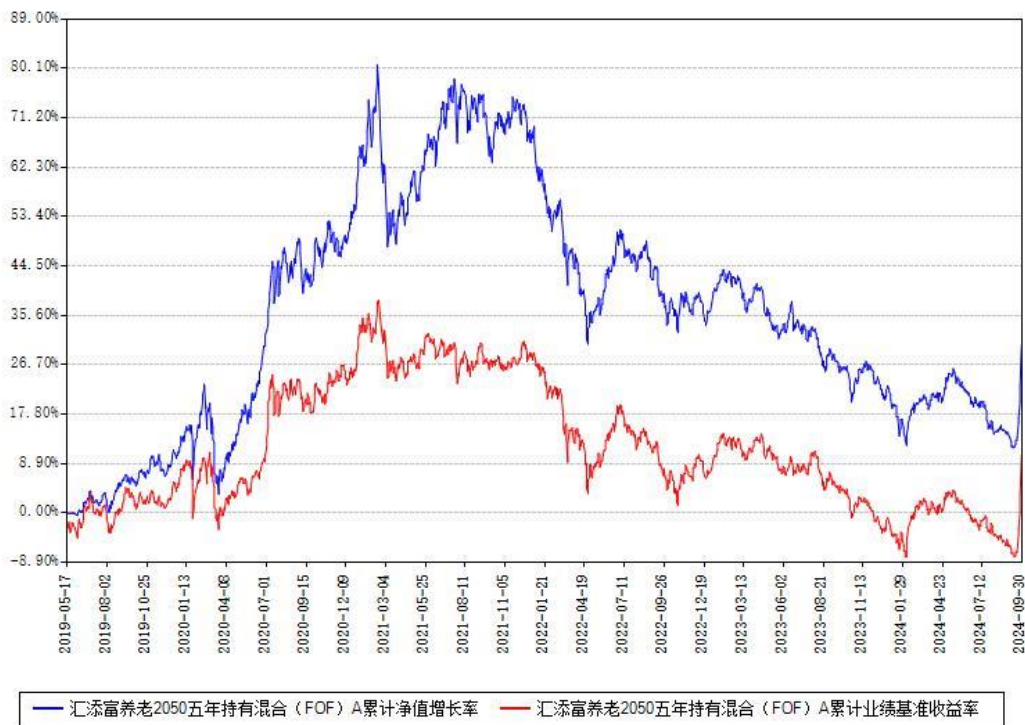
汇添富养老2050五年持有混合（FOF）Y累计净值增长率与同期业绩比较基准收益率对比图