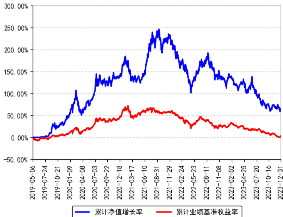
南方科技创新混合A累计净值增长率与同期业绩比较基准收益率的历史走势对比图