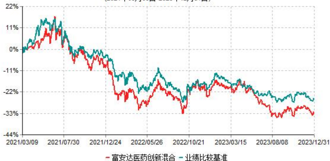
富安达医药创新混合型证券投资基金累计净值增长率与业绩比较基准收益率历史走势对比图 (2021年03月09日-2023年12月31日)