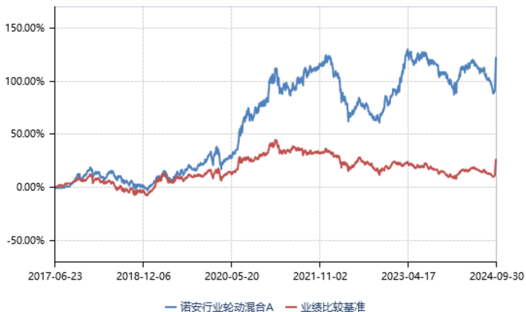
诺安行业轮动混合 C