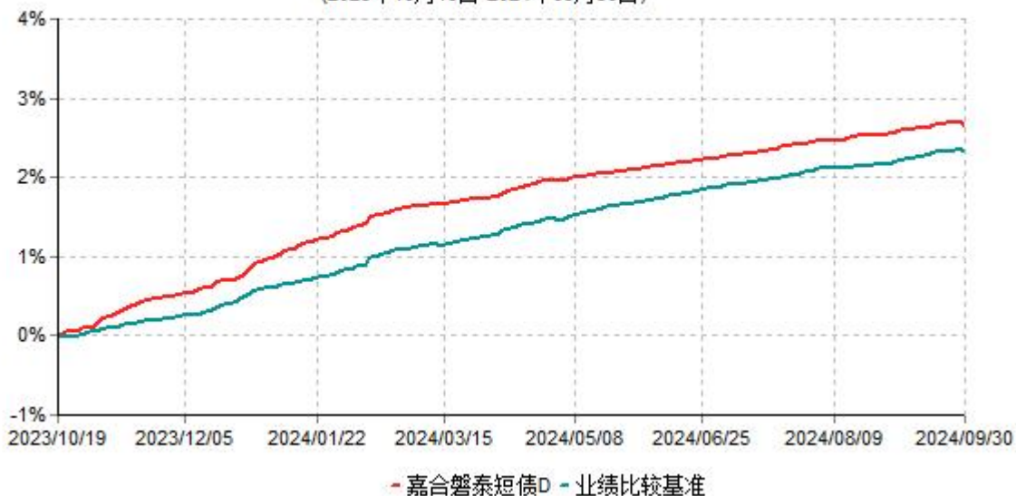
嘉合磐泰短债D累计净值增长率与业绩比较基准收益率历史走势对比图 (2023年10月19日-2024年09月30日)

注：本基金于2023年10月19日增设D类基金份额，D类基金份额实际存续从2023年10月19日开始。