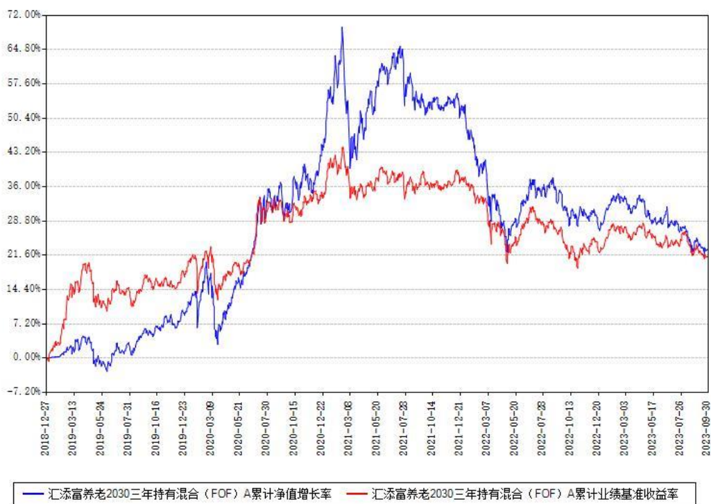
汇添富养老2030三年持有混合 (FOF) Y累计净值增长率与同期业绩基准收益率对比图