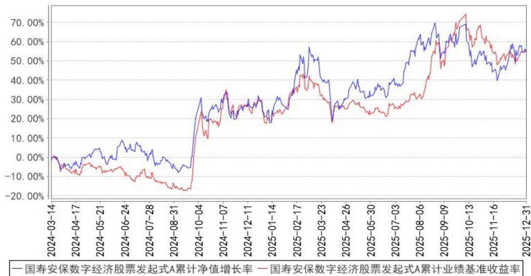
国寿安保数字经济股票发起式A累计净值增长率与同期业绩比较基准收益率的历史走势对比图