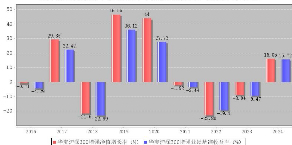
华宝沪深300增强每年净值增长率与同期业绩比较基准收益率的对比图