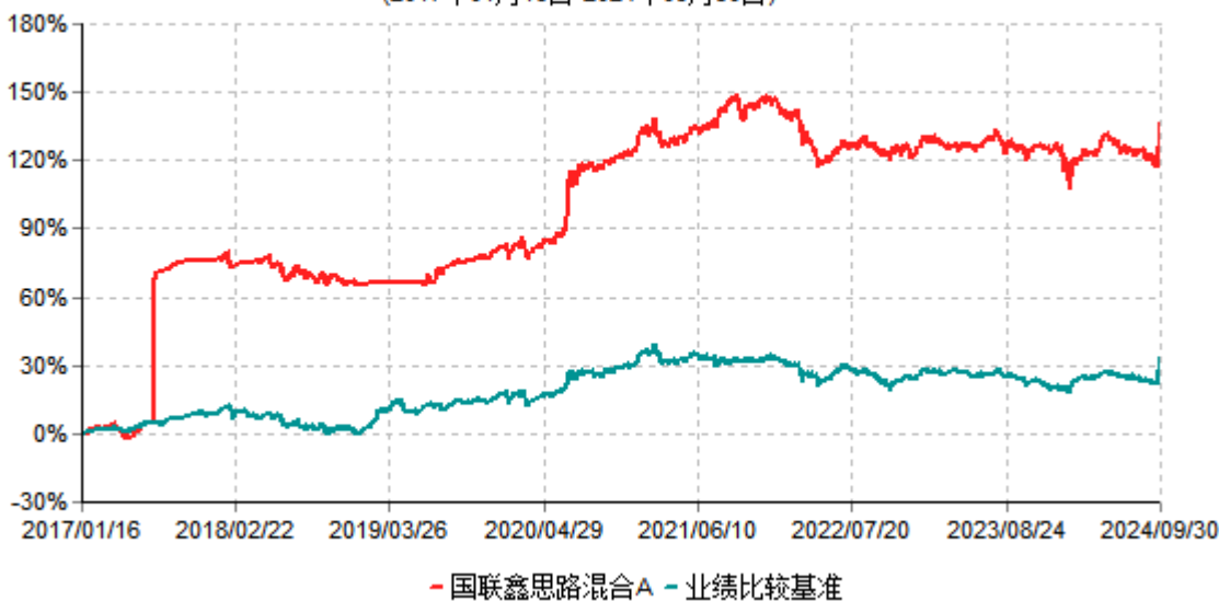
国联鑫思路混合A累计净值增长率与业绩比较基准收益率历史走势对比图 (2017年01月16日-2024年09月30日)