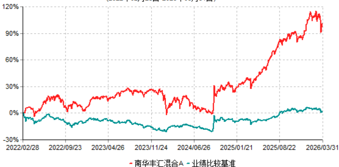
南华丰汇混合A累计净值增长率与业绩比较基准收益率历史走势对比图 (2022年02月28日-2026年03月31日)