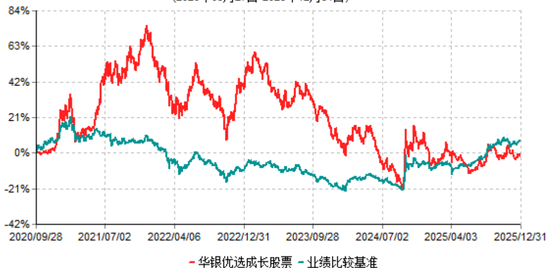
华银优选成长股票累计净值增长率与业绩比较基准收益率历史走势对比图 (2020年09月27日-2025年12月31日)