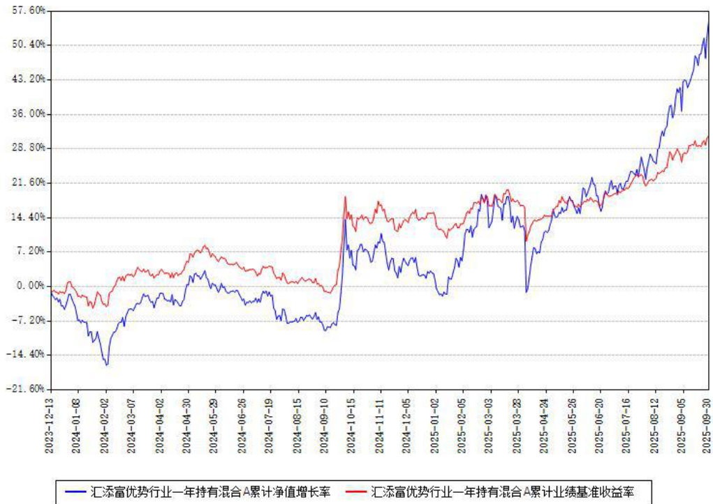
汇添富优势行业一年持有混合A累计净值增长率与同期业绩基准收益率对比图