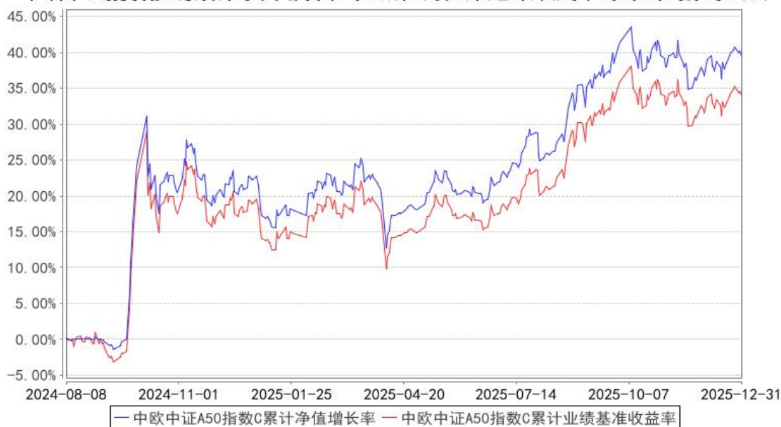
中欧中证A50指数C累计净值增长率与同期业绩比较基准收益率的历史走势对比图

注：本基金基金合同生效日期为 2024 年 8 月 8 日，按基金合同的规定，本基金自基金合同生效起六个月为建仓期，建仓期结束时各项资产配置比例已经符合基金合同约定。