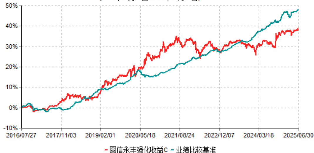
圆信永丰强化收益C累计净值增长率与业绩比较基准收益率历史走势对比图 (2016年07月27日-2025年06月30日)