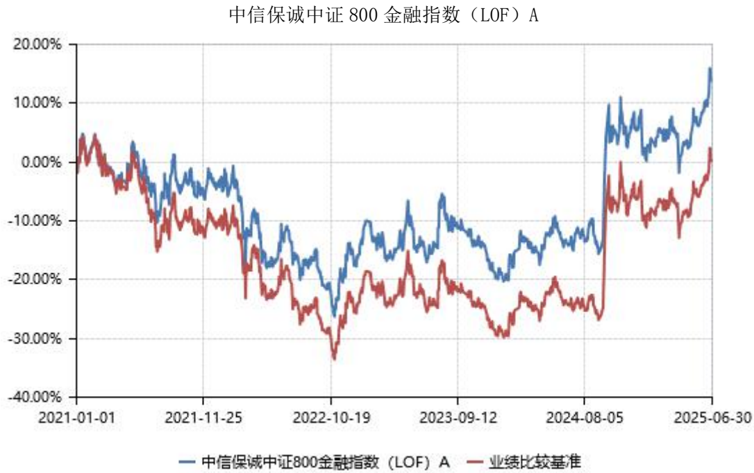
中信保诚中证 800 金融指数（LOF）C