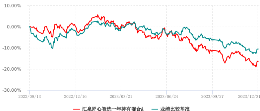
汇泉匠心智选一年持有混合A累计净值增长率与业绩比较基准收益率历史走势对比图 (2022年09月13日-2023年12月31日)