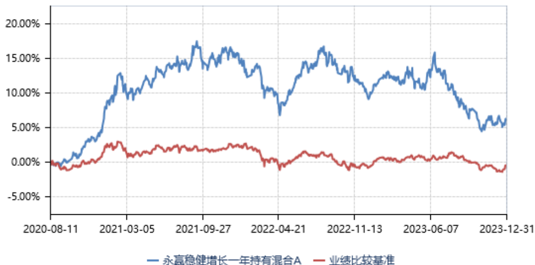
永赢稳健增长一年持有混合A累计净值收益率与业绩比较基准收益率历史走势对比图 (2020年08月11日-2023年12月31日)