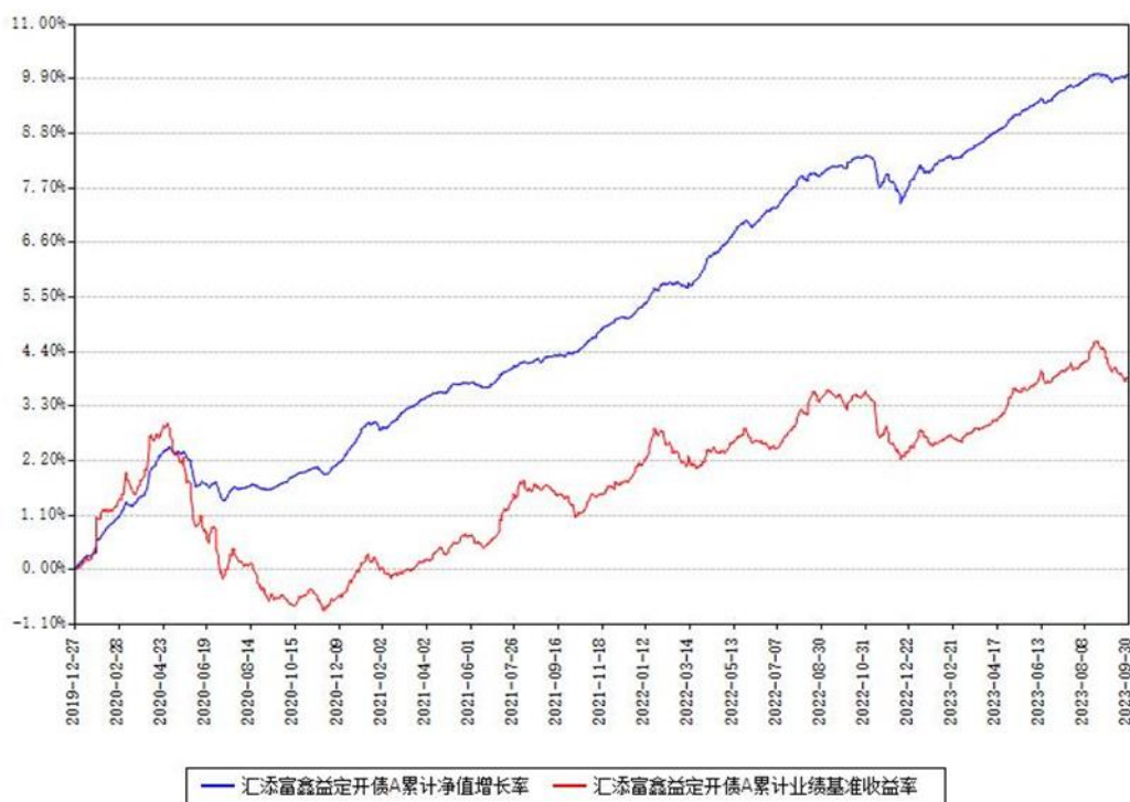
汇添富鑫益定开债A累计净值增长率与同期业绩基准收益率对比图