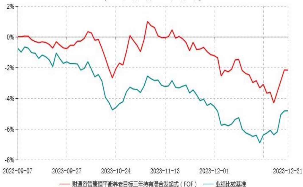
财通资管康恒平衡养老目标三年持有期混合型发起式基金中基金（FOF）累计净值增长率与业绩比较基准收益率历史走势对比图 (2023年09月07日-2023年12月31日)

注：1、本基金合同于2023年09月07日生效，截止报告期末本基金合同生效未满一年。 2、本基金建仓期为自基金合同生效日起的6个月，报告期末本基金未建仓完毕。