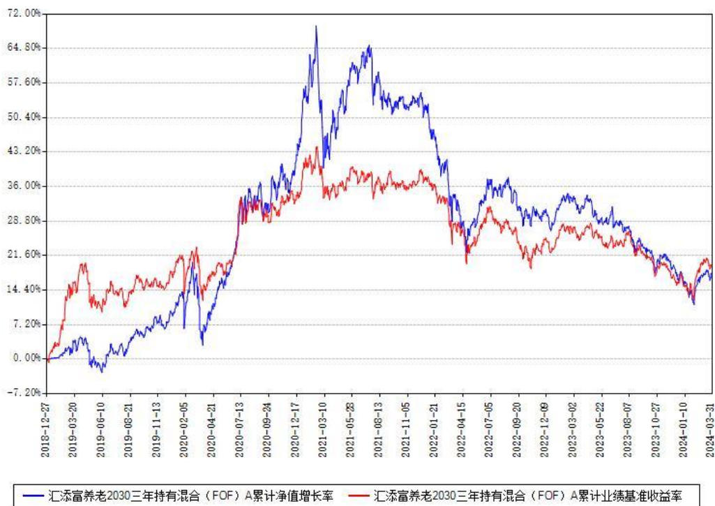
汇添富养老2030三年持有混合（FOF）Y累计净值增长率与同期业绩比较基准收益率对比图