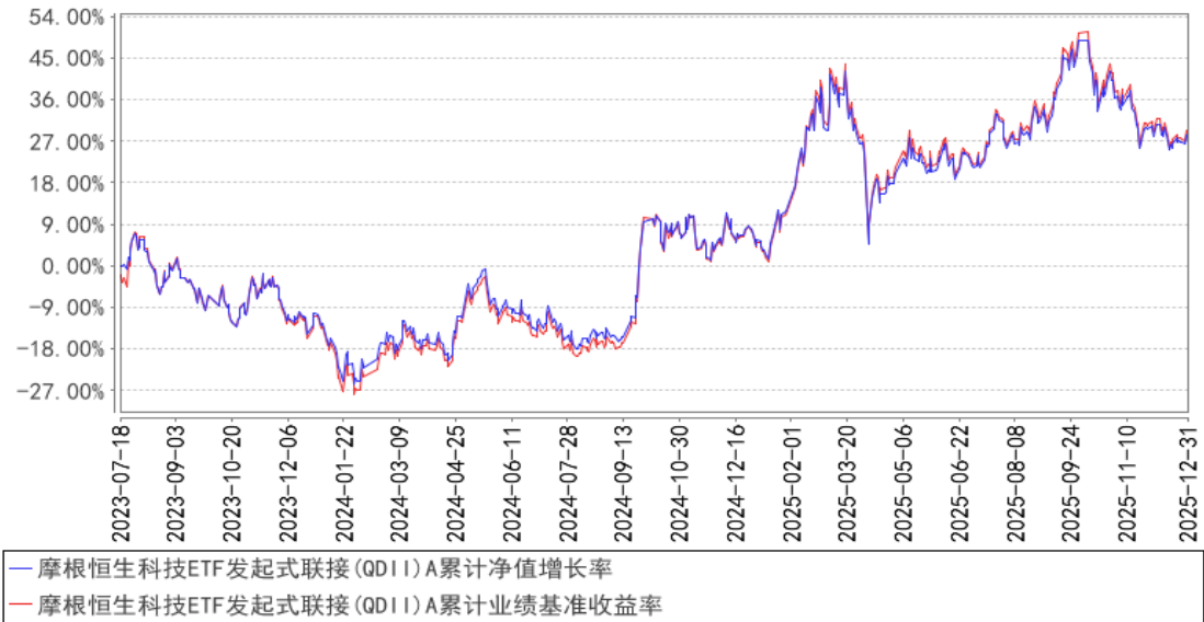
摩根恒生科技ETF发起式联接(QDII)A累计净值增长率与同期业绩比较基准收益率的历史走势对比图