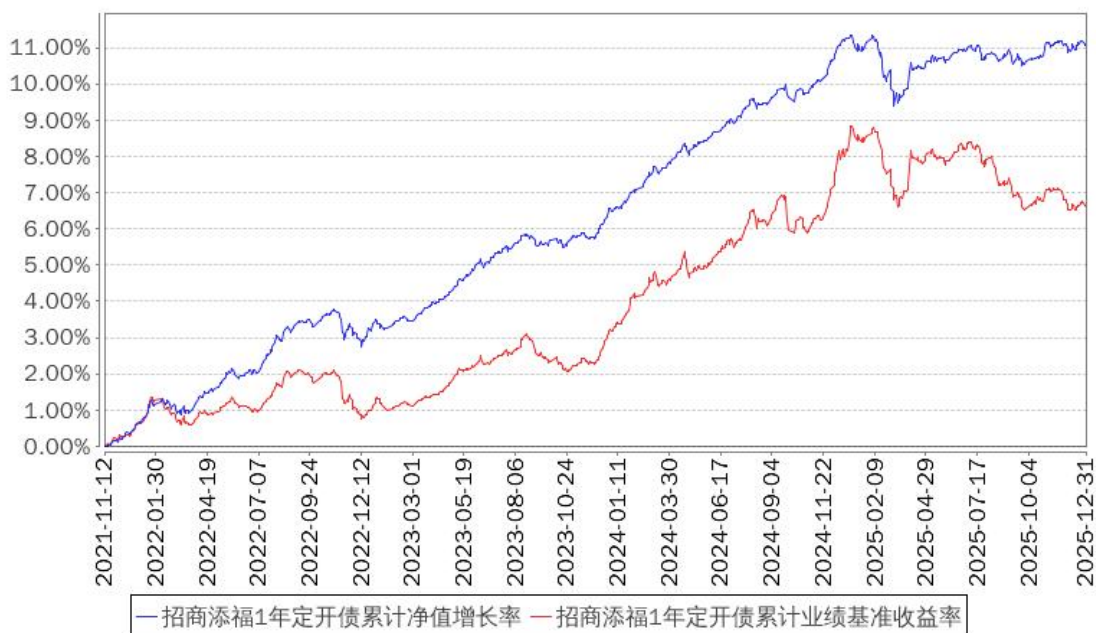
招商添福1年定开债累计净值增长率与同期业绩比较基准收益率的历史走势对比图