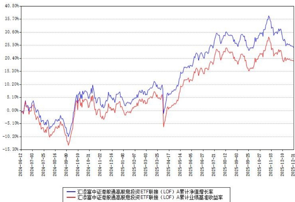
汇添富中证港股通高股息投资ETF联接 (LOF) A累计净值增长率与同期业绩基准收益率对比图