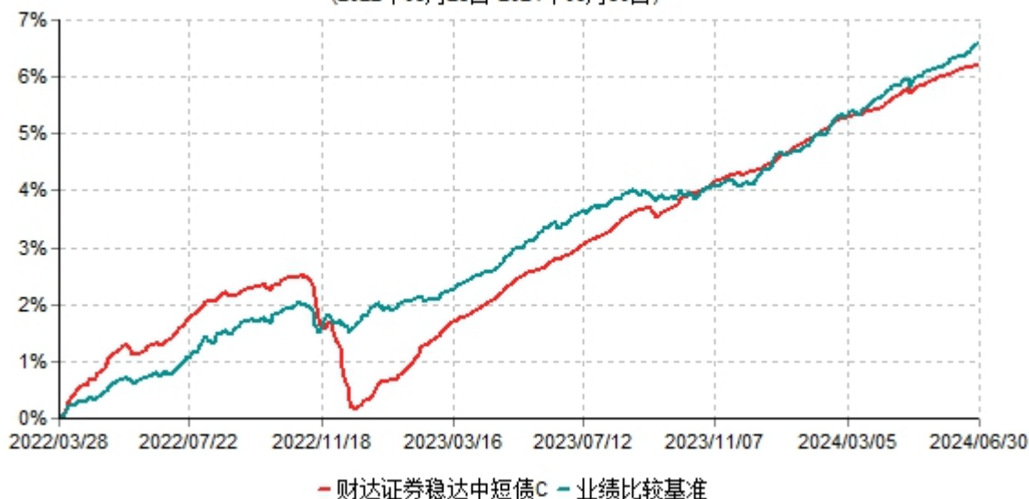
财达证券稳达中短债C累计净值增长率与业绩比较基准收益率历史走势对比图 (2022年03月28日-2024年06月30日)

2022年3月28日，财达证券稳达一号集合资产管理计划正式变更为财达证券稳达中短债债券型集合资产管理计划，即本集合计划。