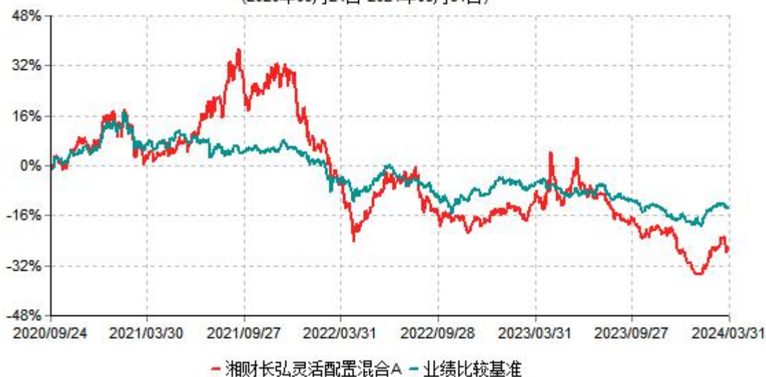
湘财长弘灵活配置混合A累计净值增长率与业绩比较基准收益率历史走势对比图 (2020年09月24日-2024年03月31日)