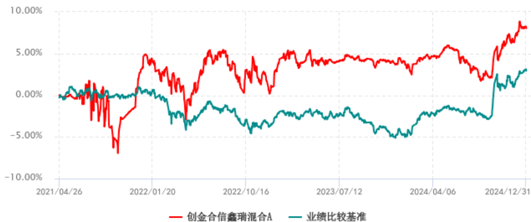
创金合信鑫瑞混合A累计净值增长率与业绩比较基准收益率历史走势对比图 (2021年04月26日-2024年12月31日)