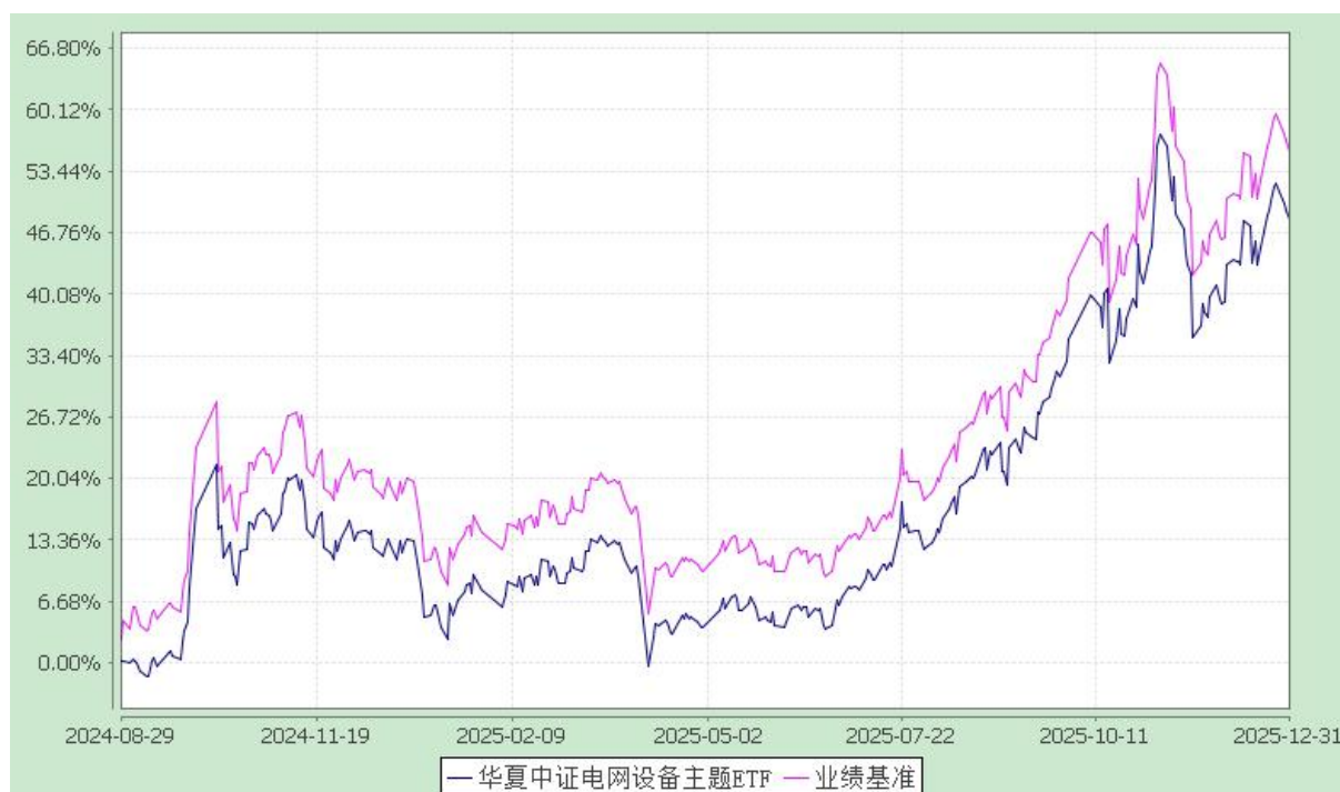
华夏中证电网设备主题交易型开放式指数证券投资基金 份额累计净值增长率与业绩比较基准收益率历史走势对比图 (2024 年 8 月 29 日至 2025 年 12 月 31 日)

注：根据本基金的基金合同规定，本基金自基金合同生效之日起 6 个月内使基金的投资组合比例符合本基金合同中投资范围、投资限制的有关约定。