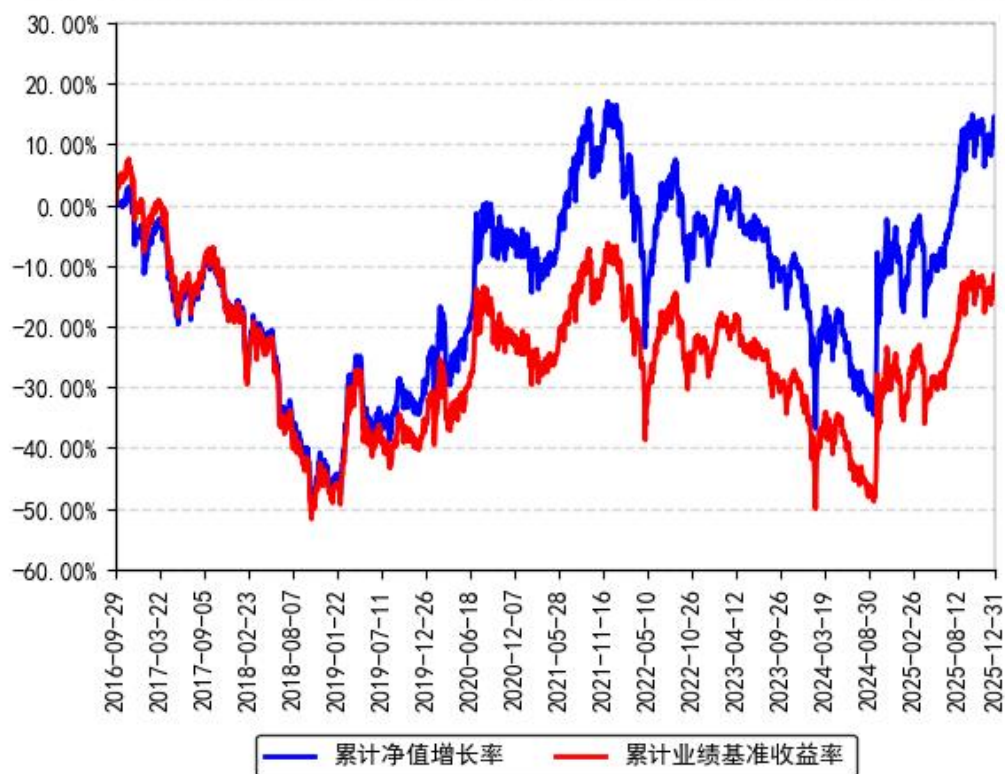
南方中证1000ETF累计净值增长率与同期业绩比较基准收益率的历史走势对比图