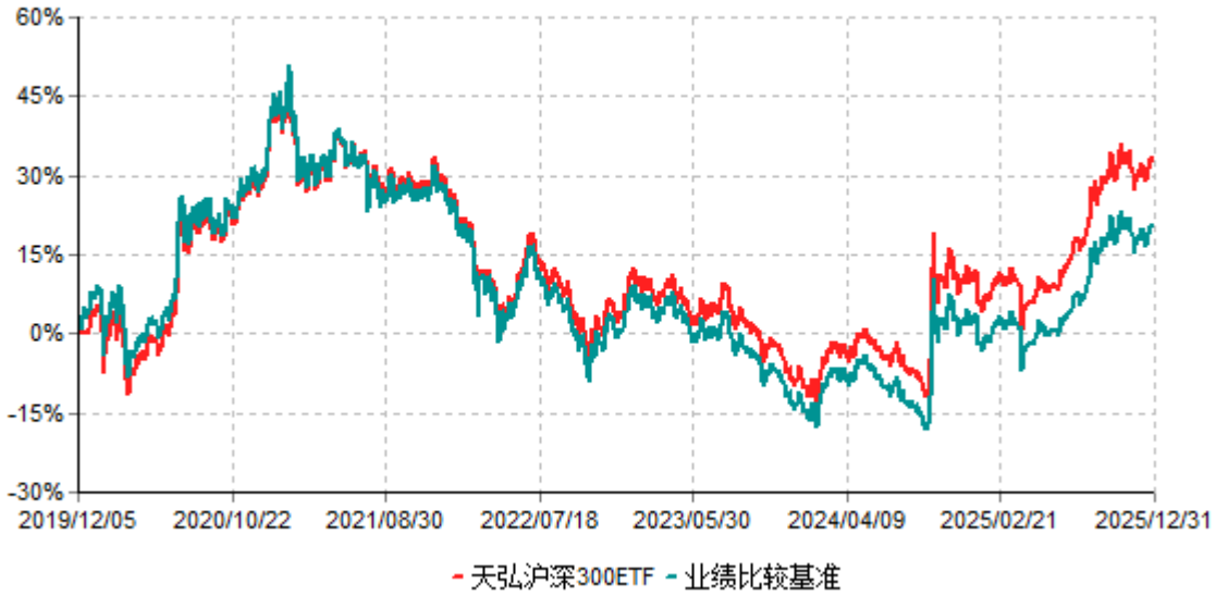
天弘沪深300ETF累计净值增长率与业绩比较基准收益率历史走势对比图 (2019年12月05日-2025年12月31日)