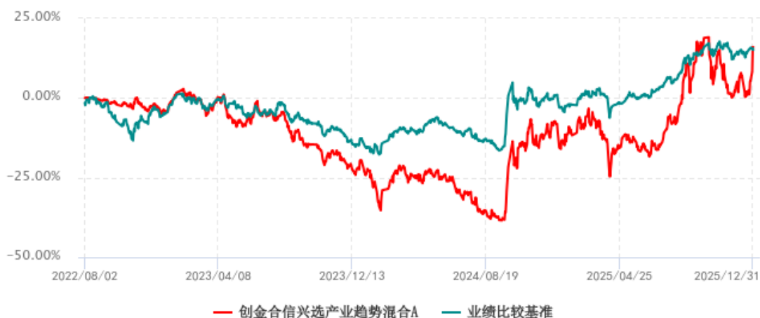
创金合信兴选产业趋势混合A累计净值增长率与业绩比较基准收益率历史走势对比图 (2022年08月02日-2025年12月31日)