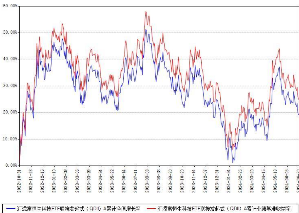
汇添富恒生科技ETF联接发起式（QDII）A累计净值增长率与同期业绩基准收益率对比图

(二) 自基金合同生效以来基金累计净值增长率变动及其与同期业绩比较基准收益率变动的比较图