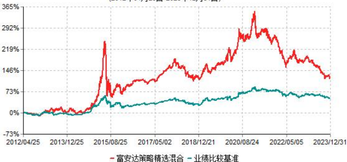
富安达策略精选灵活配置混合型证券投资基金累计净值增长率与业绩比较基准收益率历史走势对比图 (2012年04月25日-2023年12月31日)