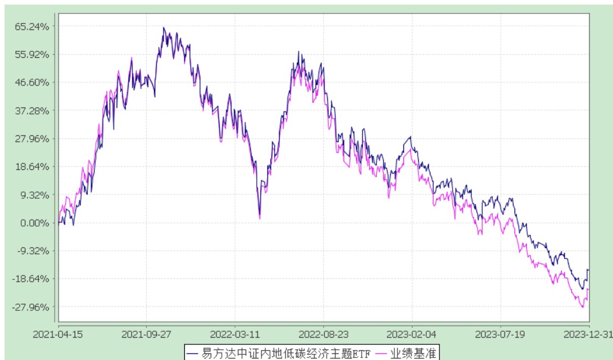
易方达中证内地低碳经济主题交易型开放式指数证券投资基金 份额累计净值增长率与业绩比较基准收益率历史走势对比图 (2021 年 4 月 15 日至 2023 年 12 月 31 日)

注：自基金合同生效至报告期末，基金份额净值增长率为-15.70%，同期业绩比较基准收益率为-22.16%。