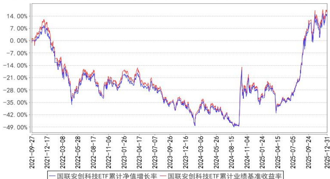
国联安创科技ETF累计净值增长率与同期业绩比较基准收益率的历史走势对比图

注：1、本基金业绩比较基准为创业板科技指数收益率； 2、本基金基金合同于 2021 年 9 月 27 日生效； 3、本基金建仓期为自基金合同生效之日起的 6 个月。建仓期结束时各项资产配置符合合同约定。