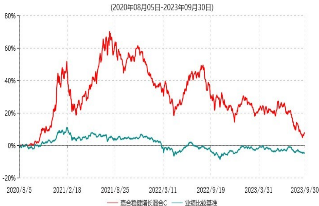
嘉合稳健增长混合C累计净值增长率与业绩比较基准收益率历史走势对比图