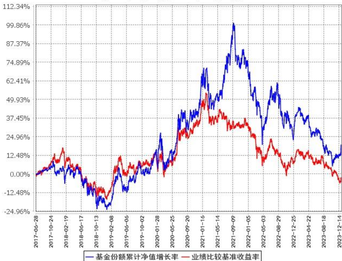
基金份额累计净值增长率与同期业绩比较基准收益率的历史走势对比图 (2017年6月28日至2023年12月31日)