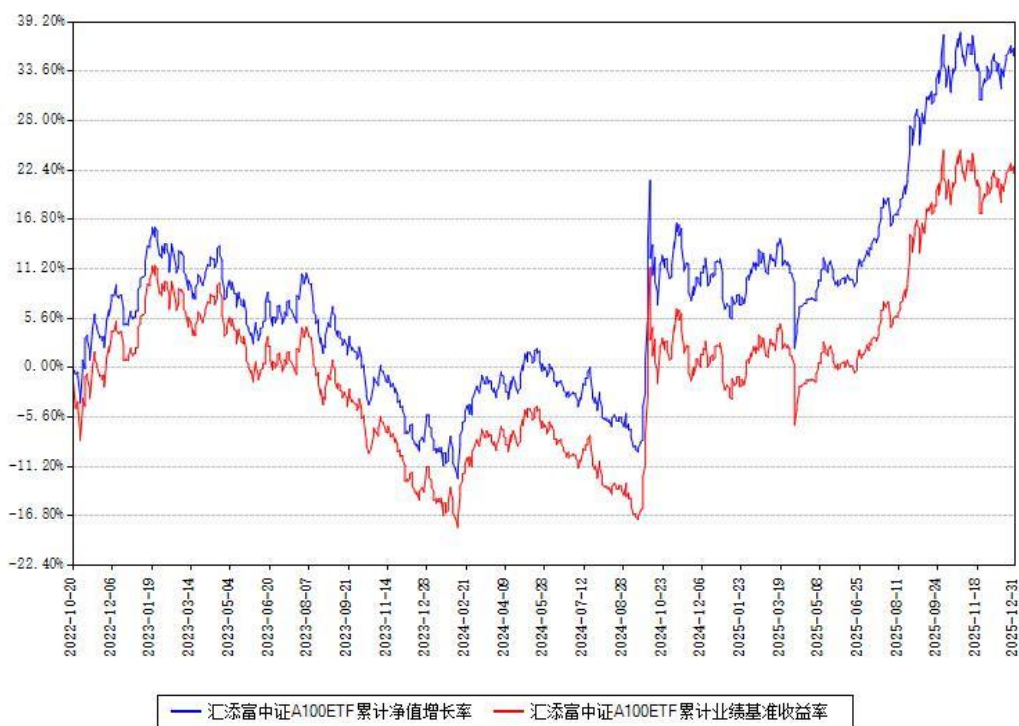
汇添富中证A100ETF累计净值增长率与同期业绩基准收益率对比图

注：本基金建仓期为本《基金合同》生效之日（2022年10月20日）起6个月，建仓期结束时各项资产配置比例符合合同约定。