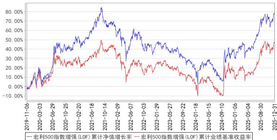
宏利500指数增强(LOF)累计净值增长率与同期业绩比较基准收益率的历史走势对比图

注：本基金于 2019 年 11 月 6 日由泰达宏利中证 500 指数分级证券投资基金转型为宏利中证 500 指数增强型证券投资基金 (LOF)。