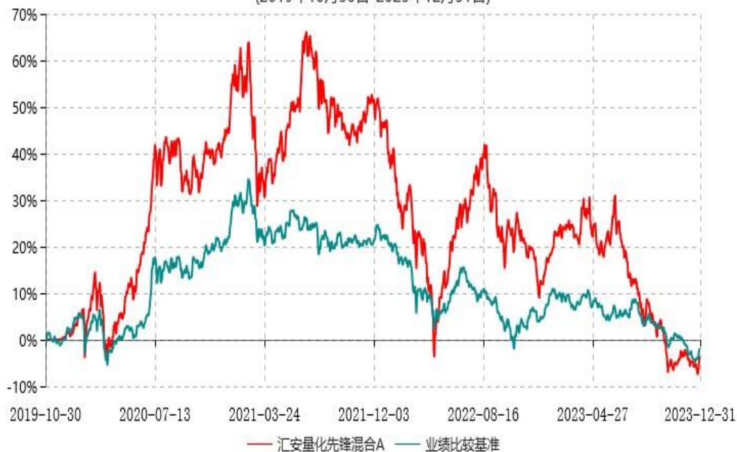
汇安量化先锋混合C累计净值增长率与业绩比较基准收益率历史走势对比图