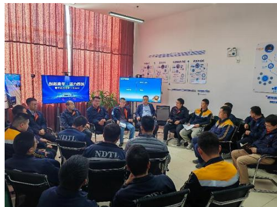
举办青年科技创新沙龙