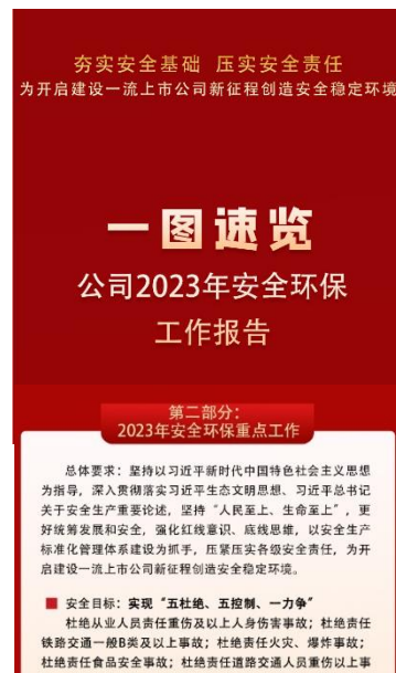
2023 年安全环保工作报告

公司及子公司均不属于环境保护部门公布的重点排污单位。未披露其他环境信息的原因 不适用