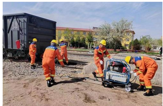
参加智能铁路运输技能竞赛

（二）社会公益。 广泛动员员工参加学雷锋志愿服务、植树造林、义务献血、青年文明岗创建、助学帮困等活动。积极推进乡村振兴，公司第四轮驻村队 2 名第一书记获得优秀等次，