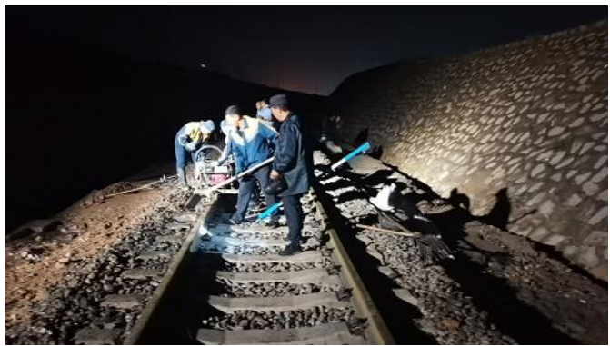
汛期快速抢修，保证运输安全