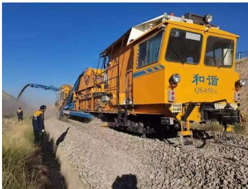
线路机械清筛作业

全检查，做好重点时段安全管控。加大计算机联锁、断轨监测设备安装、铁路沿线围网裁设、油库安全提升改造等项目安全投入，确保安全重点项目推进。截至 2023 年 6 月 30 日，实现无铁路交通一般 B 类及以上事故 2806 天，无铁路交通相撞人员伤亡事故 4211 天。宁东铁路在宁东基地首次举行的网络安全攻防演练中取得了第一名的好成绩。