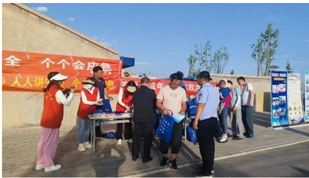
开展安全法治“五进”宣传