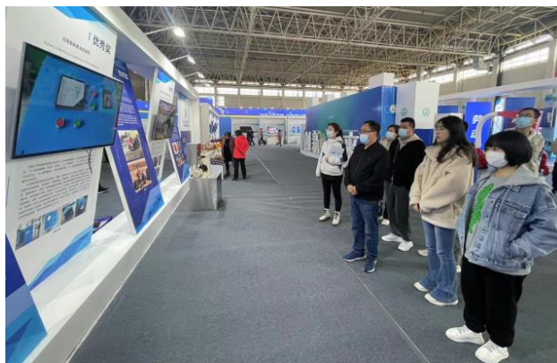
参加全区职工技术创新成果评选展览

（四）科技创新。 2023 年上半年，组织推进落实重点项目，服务经营管理和运输生产，强化科技创新和网络安全管理。行车安全预警系统进一步升级完善，收入清算与结算统计系统在宁东铁路货运作业中开始使用，机车遥控驾驶项目完成研发、测试和验收，氢能机车研发项目通过初验并下线，视频监控增设项目通过验收。鼓励“五小”创新，巩固深化 18 名“能工巧匠”、11 项技术创新成果，“远程智能黄油加注机”参展第二届全区职工技术创新成果展览。