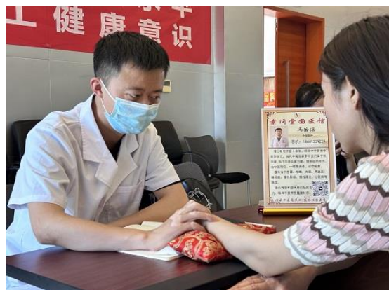
开展职工健康知识讲座暨义诊活动

（四）科技创新。 2023 年上半年，组织推进落实重点项目，服务经营管理和运输生产，强化科技创新和网络安全管理。行车安全预警系统进一步升级完善，收入清算与结算统计系统在宁东铁路货运作业中开始使用，机车遥控驾驶项目完成研发、测试和验收，氢能机车研发项目通过初验并下线，视频监控增设项目通过验收。鼓励“五小”创新，巩固深化 18 名“能工巧匠”、11 项技术创新成果，“远程智能黄油加注机”参展第二届全区职工技术创新成果展览。