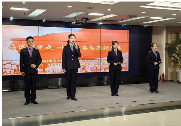
参加宁夏能源化工冶金通信工会演讲比赛