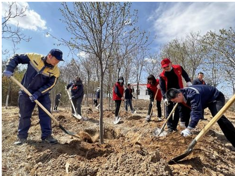
沿线站区义务植树活动