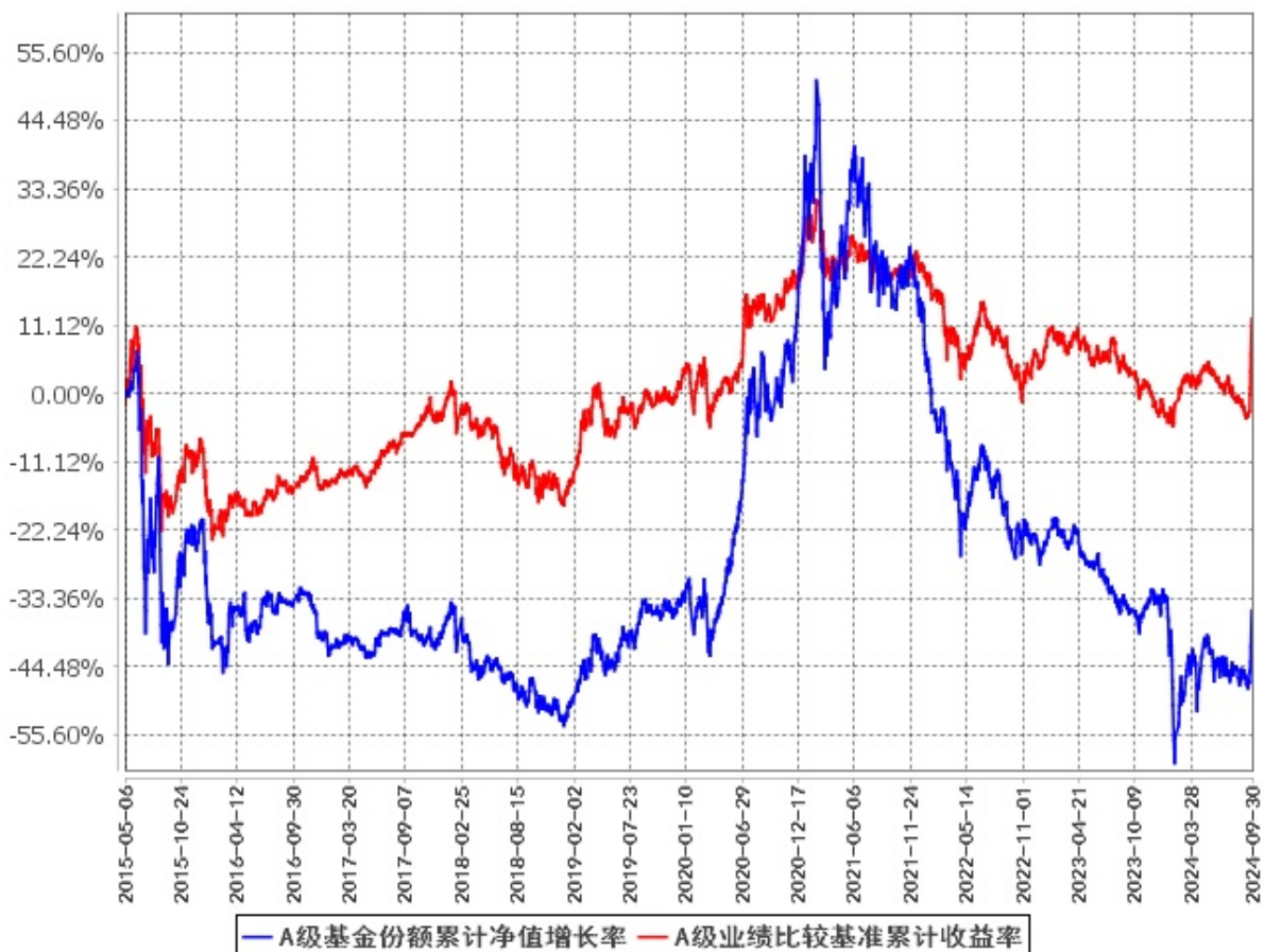
A级基金份额累计净值增长率与同期业绩比较基准收益率的历史走势对比图 (2015年5月6日至2024年9月30日)